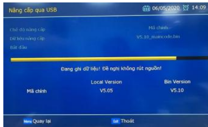
(Hình ảnh minh họa)

- Bước 4: Chọn “ Đồng ý ”, bấm “ OK ” để nâng cấp phần mềm, hoặc chọn “ Không ” để hoãn việc nâng cấp. Quá trình nâng cấp phần mềm trong khoảng 2~3 phút. Sau khi hoàn thành nâng cấp đầu thu sẽ tự khởi động lại.