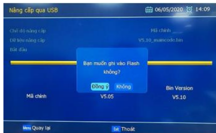
(Hình ảnh minh họa)

- Bước 4: Trong màn hình “ Nâng cấp qua USB ”, trên thông báo hiển thị chọn “ Đồng ý ”, bấm “ OK ” để thực hiện nâng cấp.