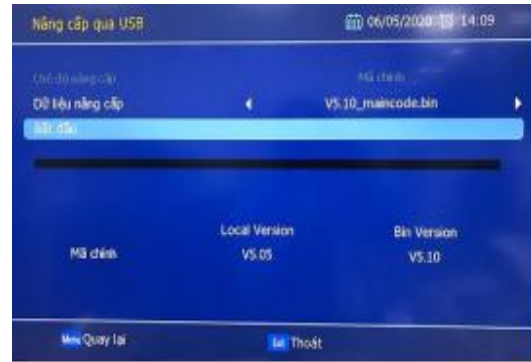
(Hình ảnh minh họa)

- Bước 4: Trong màn hình “ Nâng cấp qua USB ”, trên thông báo hiển thị chọn “ Đồng ý ”, bấm “ OK ” để thực hiện nâng cấp.